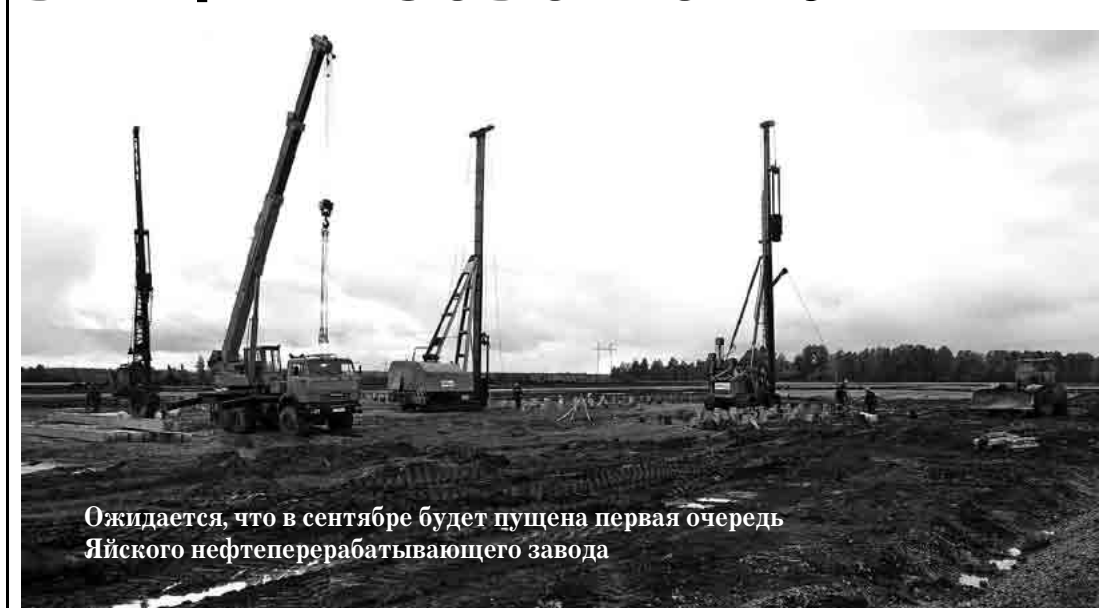
Ожидается, что в сентябре будет пущена первая очередь Яйского нефтеперерабатывающего завода