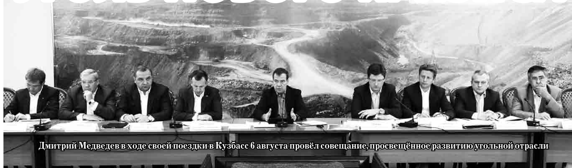
Дмитрий Медведев в ходе своей поездки в Кузбасс 6 августа провёл совещание, посвящённое развитию угольной отрасли

Нынешний свой профессиональный праздник угольщики встречают почти как четыре года назад – в тревожных ожиданиях. С прошлой осени, когда фиксировались рекордно высокие цены на топливо на мировых рынках, стоимость кузбасского угля упала на 50, а в отдельных случаях на 70%. В отрасли снова заговорили о сокращении издержек, введении сокращённого рабочего дня.