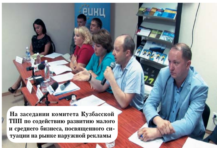
На заседании комитета Кузбасской ТПП по содействию развитию малого и среднего бизнеса, посвященного ситуации на рынке наружной рекламы

Рабочая группа (в неё вошли представители рекламного сообщества, КТПП и журналисты), которая была создана после заседания комитета, сейчас пытается разработать конкретные меры, которые могли бы способствовать налаживанию диалога между мэрией и предпринимателями. В частности, администрации предлагается совместная с бизнесом