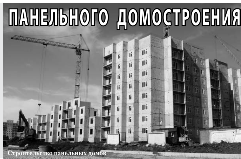
Строительство панельных домов

Кризисные явления внесли существенные коррективы в строительный рынок — в частности, заметно выросла доля жилья, возводимого на бюджетные средства. Коммерческое строительство также смещается в сегмент «эконом». А значит, растёт актуальность панельного домостроения. О том, отличаются ли современные панельные дома от своих «собратьев» родом из 80-х и какие возможности открывает данная технология строительным компаниям, мы беседуем с коммерческим директором ООО «ПК «Стройиндустрия» Еленой Нинишвили.