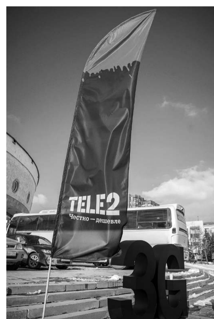
Запуск 3G от Tele2 в Кузбассе может «случиться» уже в апреле