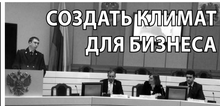
СОЗДАТЬ КЛИМАТ ДЛЯ БИЗНЕСА В конце апреля прошло первое заседание Экспертно-консультативного совета при уполномоченном по защите прав предпринимателей в Кемеровской области.